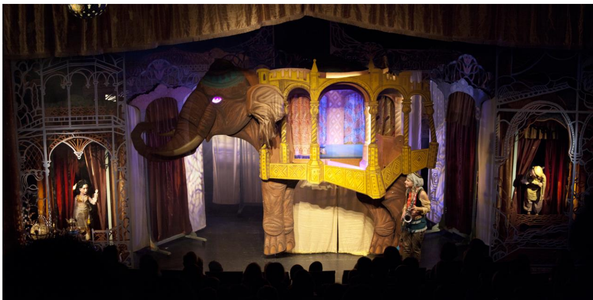
Obr. Divadelní představení bří Formanů – Aladin

Chvalská stodola dále a především vytváří důstojné a pravidelné zázemí pro hojně poptávané akce MČ Praha 20, spolků a dalších veřejných institucí.