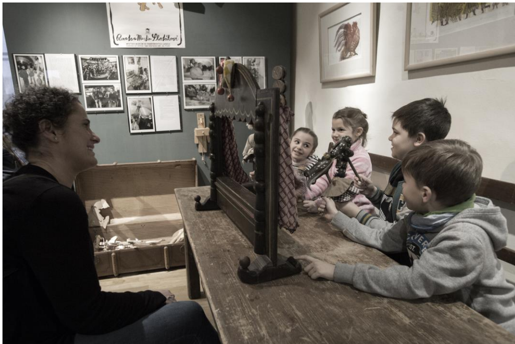
Obr. Imaginárium bratří Formanů a jejich přátel