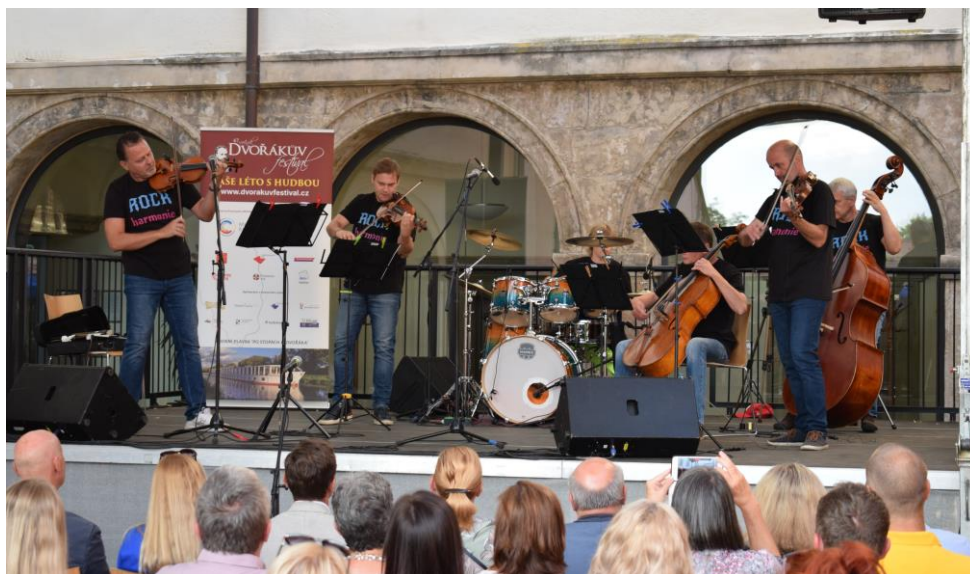
Obr. koncert ROCK Harmonie – Dvořákův festival