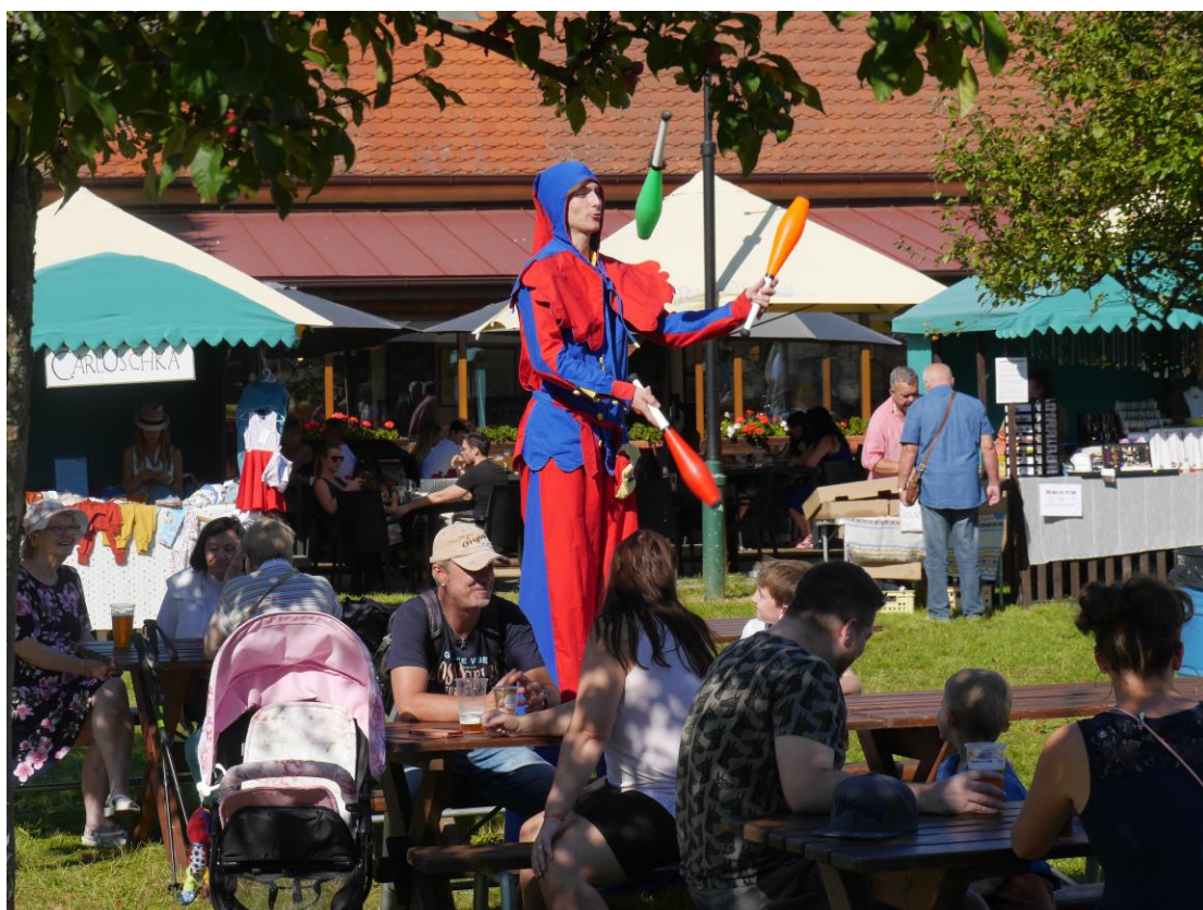
Svatoludmilská pouť na Chvalské tvrzi