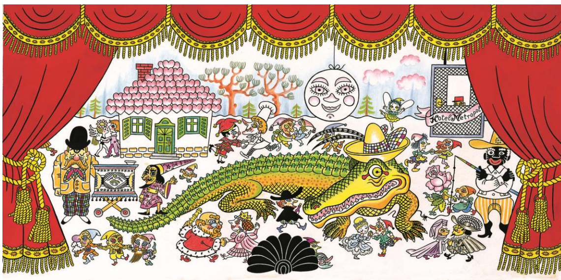
Obr. Helena Zmatlíková - Putování za švestkovou vůní, výstava Helena Zmatlíková dětem - 100 let (Chvalský zámek, 18.11.2023 – 18.8.2024)

Výstava ke 100. výročí narození Heleny Zmatlíkové (18.11.2023 – 12.5.2024) je ojedinělým projektem vzhledem k významnému výročí této nepřehlédnutelné postavy dětské ilustrace 20. století a dá se říci, že tento vzpomínkový projekt byl v celé České republice kupodivu zcela unikátní (jiné větší akce se k tomuto výročí neuskutečnily) a přilákal na Chvalský zámek rovněž velký počet návštěvníků.