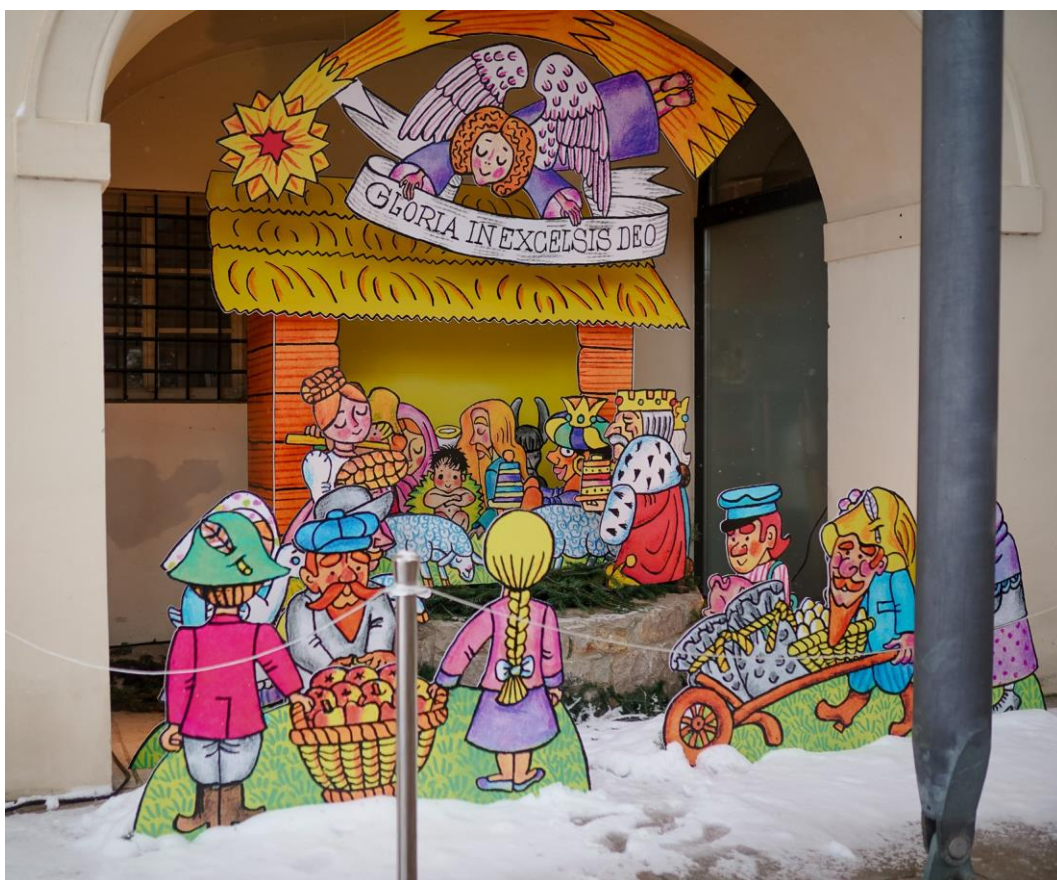
Obr. adventní nádvoří na Chvalském zámku