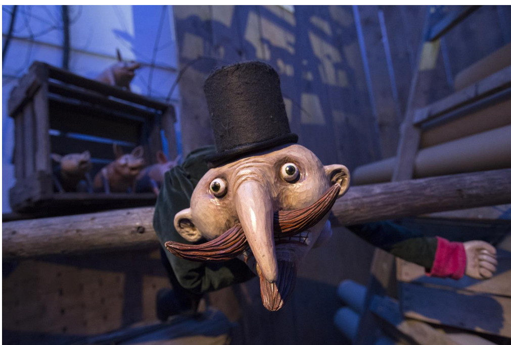
Obr. z výstavy Imaginárium Divadla bratří Formanů a jejich přátel (21.1. – 11.6.2023)

Výsledek hospodaření Chvalského zámku za rok 2023 je tvořen zlepšeným hospodářským výsledkem 188.094,09 Kč, z toho z hlavní činnosti ve výši 106.903,15 Kč a ziskem v doplňkové činnosti ve výši 81.190,94 Kč.