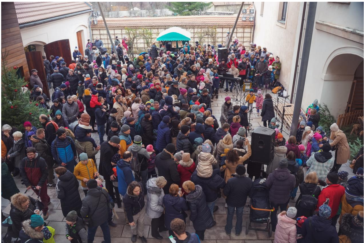
Obr. Zavírání Vánoc na Chvalském zámku

Naše velké poděkování patří rovněž zřizovateli Městské části Praha 20 za finanční i lidskou podporu – dále velmi děkujeme Odboru sociálních věcí a školství za přívětivé metodické vedení a Odboru místního hospodářství za vytrvalou spolupráci při přípravě akcí pro veřejnost.