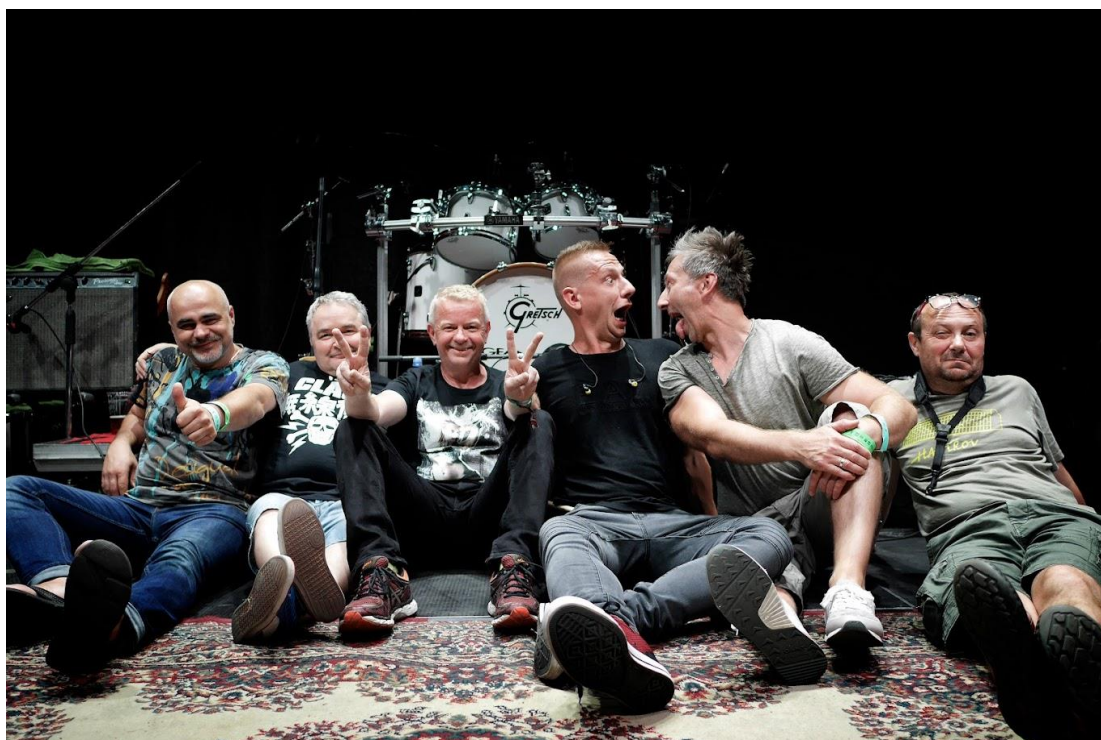
Obr. Čarodějnice na Chvalské tvrzi 2023: kapela Mňága a Žďorp